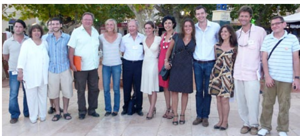
Membres du collectif «Ensemble pour un Paris démocrate»