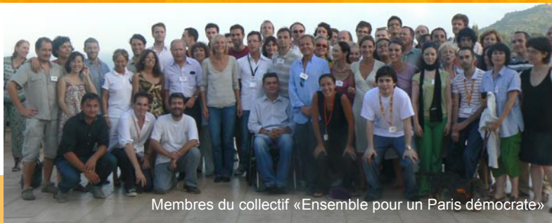
Membres du collectif «Ensemble pour un Paris démocrate»